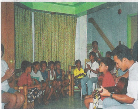
Avondsluiting in het jongenshuis

Bij de start beschikten we alleen over een inlooptcentrum, waar wij maximaal 50 jongens per nacht konden herbergen. Steeds meer jongens wilden permanent blijven. Ook wilden we graag dat de jongens in gezinsverband zouden samenwonen en dat ze de mogelijkheid kregen om naar school te gaan. Er werd toen een huis voor de jongens gehuurd.