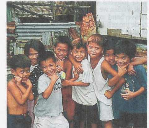
Kinderen in de sloppenwijk van Cebu City spelen boven op het vuilnis