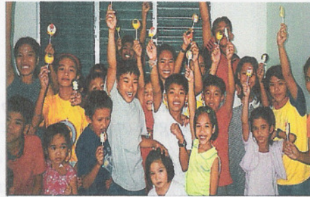
Het is al gauw feest, wanneer iedereen een lolly heeft

We zagen de nood onder de meisjes die op straat leefden. Overwegend komen ze in de straatprostitutie terecht. Na veel overleg en advies van diverse mensen namen we het besluit om meisjes op te nemen voordat ze op straat terecht zouden komen.