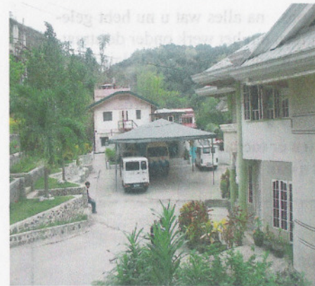
Overzicht van het project

In 1998 kwam het eerste huis gereed. Daarna werden er nog vier huizen door aannemers gebouwd. Toen we verder gingen met de aanleg van de dijk langs de rivier gebeurde dat in eigen beheer, waarvoor in totaal vijftien bouwvakkers werden aangenomen. Zij bouwden de drie meter hoge en 60 meter lange dijk, het zesde huis, de weg met een hoogte verschil van zeven meter achter de huizen, het basketbalveld, de kantoren, de watertoren en het multifunctionele activiteitencentrum. Ook nu gaat de bouw nu steeds door. Er is m.n. nog veel te doen aan de infrastructuur.